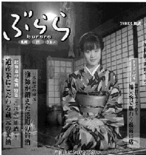
地元出版社が出している観光情報誌「ぶらら」。北海道の地酒の特集で表紙を含めた写真、取材を担当しました。

北海道の観光情報は似たりよったり差別化した記事作りをお手伝いします これまで札幌市の観光「そさっぽろ」など、企画・取材経験も豊富です。