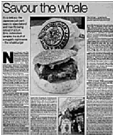
英国紙ガーディアンの特集「日本のクジラ食文化」の写真撮影を担当しました = 2005年